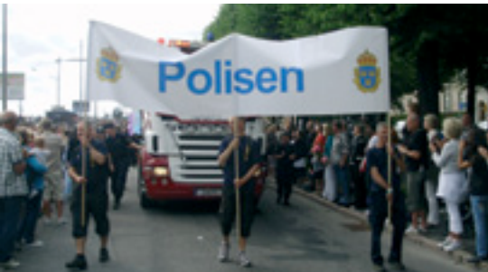
Policijski/e službenici/e švedske policije u Povorci ponosa 2010

počinjeno iz mržnje prema osobi zbog njezine rase, boje kože, spola, spolne orijentacije, jezika, vjere, političkog ili drugog uvjerenja, nacionalnog ili socijalnog podrijetla, imovine, rođenja, naobrazbe, društvenog položaja, dobi, zdravstvenog statusa ili drugih osobina.